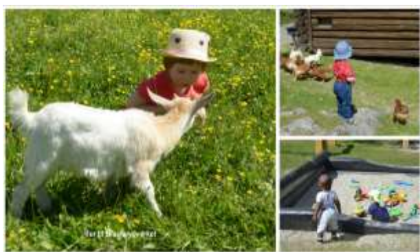
Bilde er fra tur til Blaafarveverket