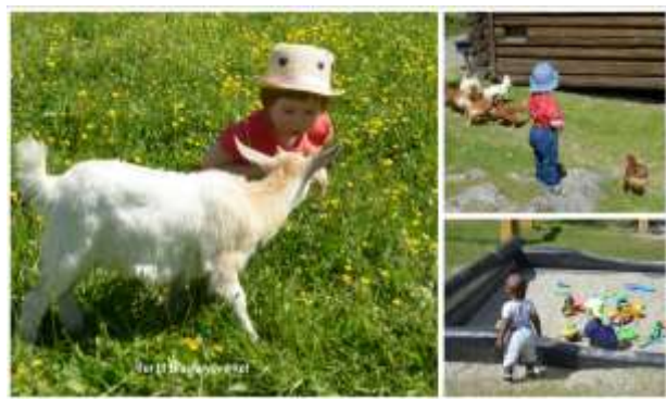
Bilde er fra tur til Blaafarveverket